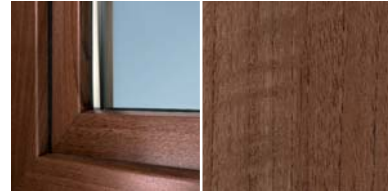
Dekorfolie Siena Rosso*1

Mit BE Kunststoff-Fenstern in edler Dekor-Optik setzen Sie ganz persönliche Akzente – und dank eines fast unbegrenzten Farbspektrums sind Ihnen dabei praktisch keine Grenzen gesetzt. Dazu bietet Ihnen BE Bauelemente – als Schüco Premium Partner – die innovativen Holzdekore Siena Noce und Siena Rosso. Diese neuen Dekore vermitteln den Eindruck einer offenporig lackierten, geschliffenen Walnussholzoberfläche – ein Unterschied zu herkömmlichen Holzfenstern ist kaum sichtbar.