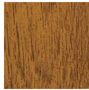
Dekorfolie Golden Oak*1,2