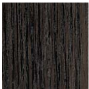
Dekorfolie Eiche Dunkel*2