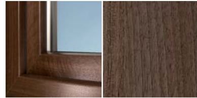
Dekorfolie Siena Noce*1

Komplettiert wird das Standard-Dekor-Sortiment durch 11 weitere Dekore, die eine attraktive Mischung aus Tradition und Moderne bilden. Weitere Dekore als Sonderfoliierung erhältlich.